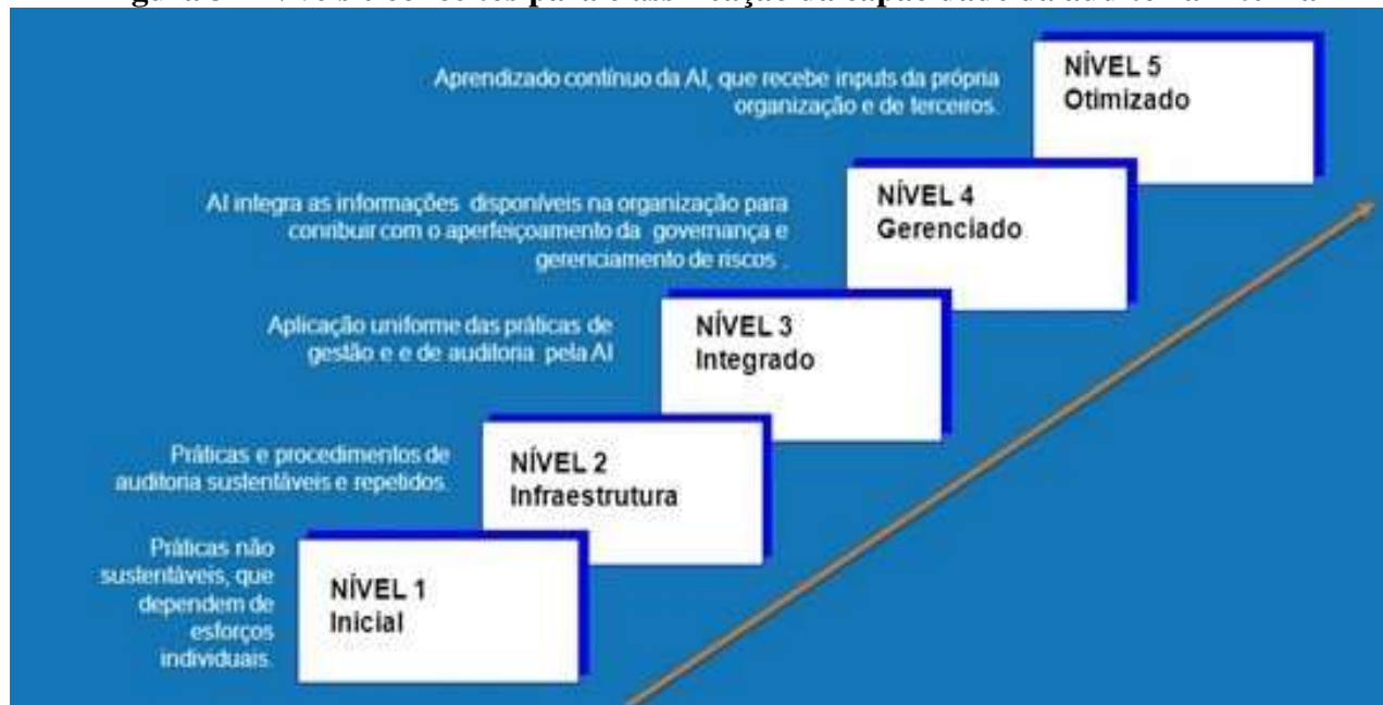
Figura 3 – Níveis e conceitos para classificação da capacidade da auditoria interna