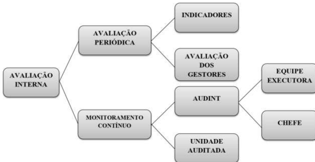
Figura 1 – Estrutura da avaliação interna das atividades da AUDINT/UFERSA

A Figura 1 mostra a estrutura de avaliação interna das atividades da AUDINT da UFRSA.